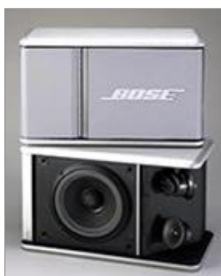
スピーカーの外観、ラインともに白。グリルの色は4色です。