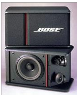
スピーカーの外観は黒。 正面に赤いラインがあります。

対象製品 : 301-AV MONITOR (301AVM) (全色 : 黒、白、赤、青、緑、シルバー) 上記製品名301AVの後に、小さな文字でTMと記載があるもの 製造期間 : 1988年8月より1997年5月 該当DOM No. : 48801 ~ 49709 (D.O.M.ナンバーです。製造番号ではありません。)